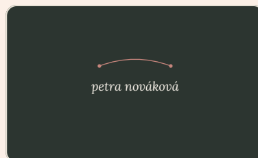
Tmavá · pro tisk a tmavé pozadí