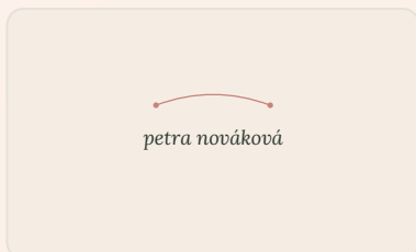
Hlavní · na světlém pozadí

Hlavní pro běžné použití na světlém pozadí, růžová pro slavnostní (vizitky, certifikáty) a tmavá pro tisk nebo dárkové předměty.