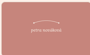
Růžová · slavnostní